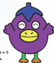
摂津市ゆるキャラ なす丸くん