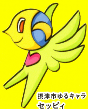
摂津市ゆるキャラ セツピィ

介護職員・看護師・ヘルパー・調理・生活支援員・ケアマネ・事務員・送迎ドライバーなどを募集します。 無資格・未経験の方や短時間勤務を希望の方も、お気軽にご相談ください。